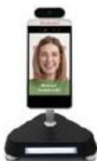
KSU-TSK-011D Disposition comptoir